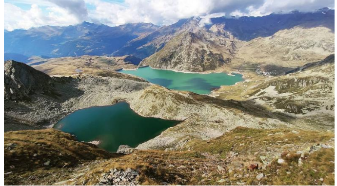
Panorama dal Pizzo Spadolazzo